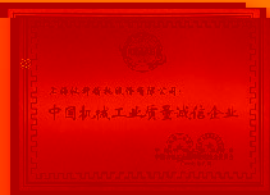
中国机械工业质量诚信企业