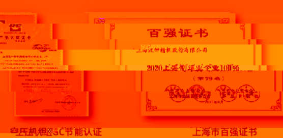
空压机能效3C节能认证