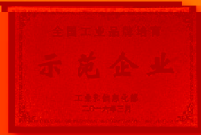
全国工业品牌培育示范企业